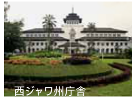
西ジャワ州庁舎 アールデコ(1930年代ヨーロッパ調の建築様式)の代表的な建物である西ジャワ州庁舎。

ティーガーデンリゾート・バンドン コテージ 日本人の生活様式を熟知した無駄のない設計と、リゾートならではの「遊び心」が生きた空間。高原ならではの暖炉や、緑の空間を独占できる屋上デッキなど、リゾートならではの隠し味がいっぱい。24時間安心のセキュリティー、フロントには日本人コンシェルジュも常駐し、あなたの生活をフルサポート致します。