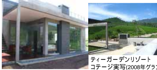
ティーガーデンリゾート コテージ実写(2008年ランドオープン)