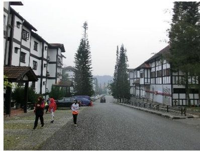
途中のコンドミニアム街