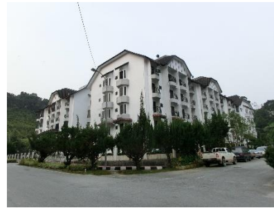
宿近くのコンドミニアム