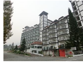
ヘリテージ・ホテル